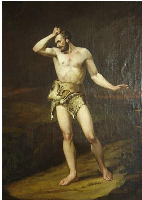
Figura 4 - Caim amaldiçoado , João Maximiano Mafra, 1851. Óleo s/tela, 113 x 83,5 cm. Museu D. João VI/EBA/UFRJ. Em domínio público.

Para transladar nosso raciocínio ao campo do concreto, apontamos três tópicos extraídos do L'image du monde enquanto receituário das manifestações do pathos . São eles: “E quando falares de um fato cruel ou com cólera, fecha teu punho e agita teus braços” (...) “E quando falares de um assunto santo com devoção, eleva teus olhos e mãos” (...) “E quando falares com suavidade, doçura ou humildade, apoia tuas mãos sobre o peito” (MERTZ, 1247, p.68). O primeiro se relaciona diretamente com o posicionamento adotado por João Maximiano Mafra em Caim amaldiçoado de 1851, acervo do Museu D. João VI/EBA/UFRJ (Figura 4).