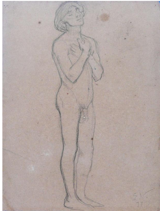
Figura 6 - São Sebastião (estudo para Recompensa de São Sebastião ), Eliseu D'Angelo Visconti, 1897. Crayon s/papel, 32 x 24 cm. Coleção particular. Fonte: Projeto Eliseu Visconti. Em domínio público.