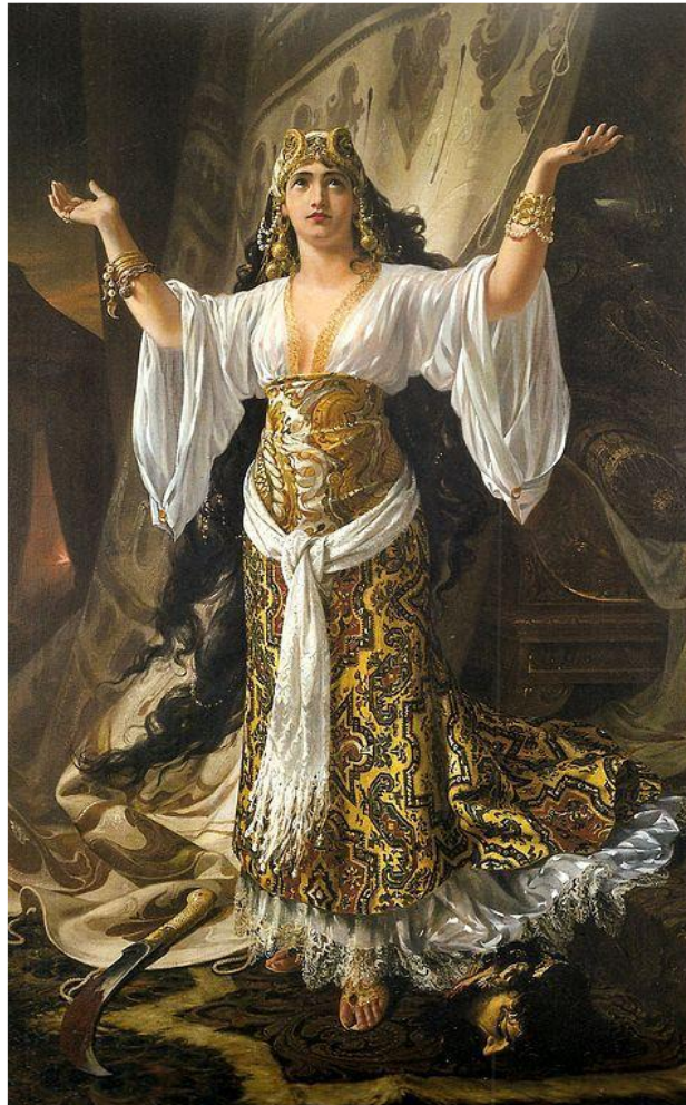
Figura 5 - Judite rende graças a Jeová por ele ter conseguido livrar sua pátria dos furores de Holofernes , Pedro Américo de Figueiredo e Melo, 1880. Óleo s/tela, 229 x 141,7 cm. Museu Nacional de Belas Artes. Em domínio público.

O último nos parece ser a síntese da Recompensa de São Sebastião em todos os estudos elaborados por Visconti (Figura 6 e Figura 7) e, ulteriormente, na tela finalizada. Podemos afirmar que desde o primeiro estudo sobre a figura de São Sebastião, Visconti já adotara as mãos sobre o peito. Constatação que aumenta nossa suspeita que o receituário de imagens corporais de Mertz possa ter sido alicerce, talvez indiretamente, do processo criativo do pintor brasileiro.